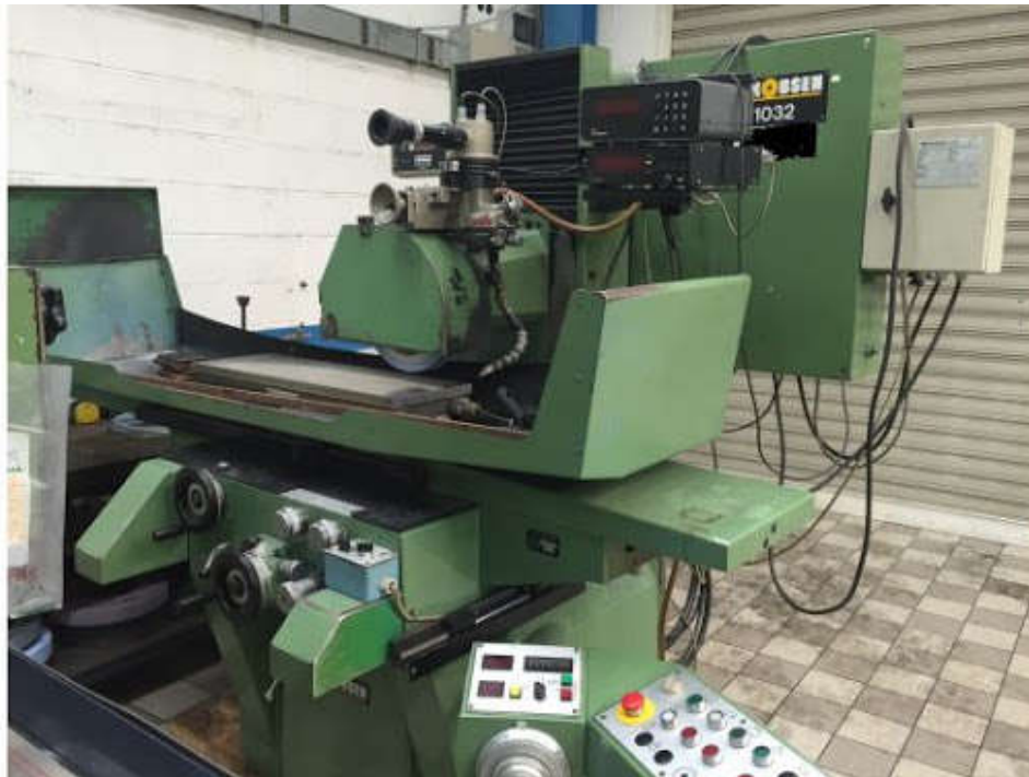
Photographie d'une rectifieuse plane, modèle Jakobsen 1032.