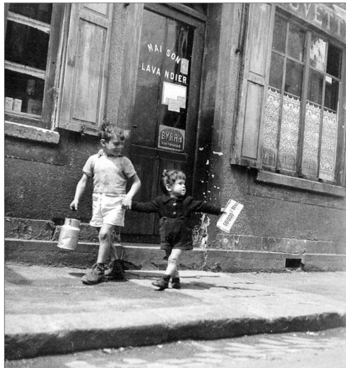
Robert Doisneau, Rue Marcellin Berthelot, Choisy-le-Roi, 1945