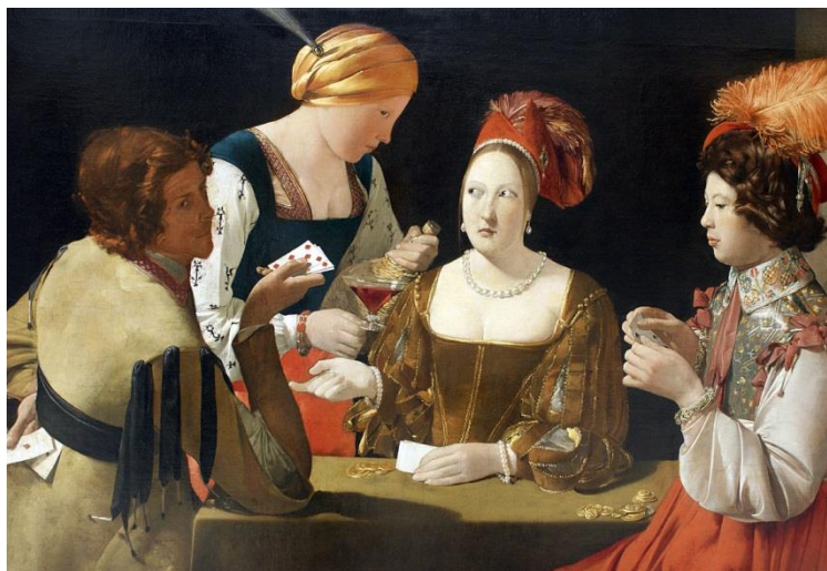
Georges de La Tour : Le Tricheur à l'as de carreau , 1636, Paris, Musée du Louvre.

Quel tableau préférez-vous et pourquoi ?