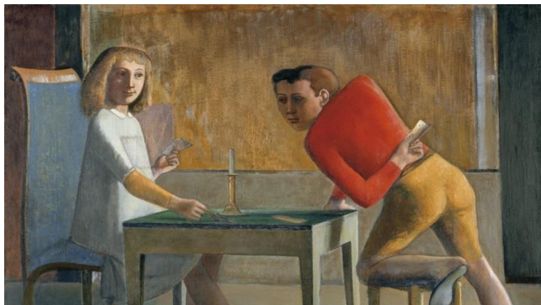
Balthus, Le Jeu de cartes , 1950, Madrid, Musée Thyssen Bornemisza.