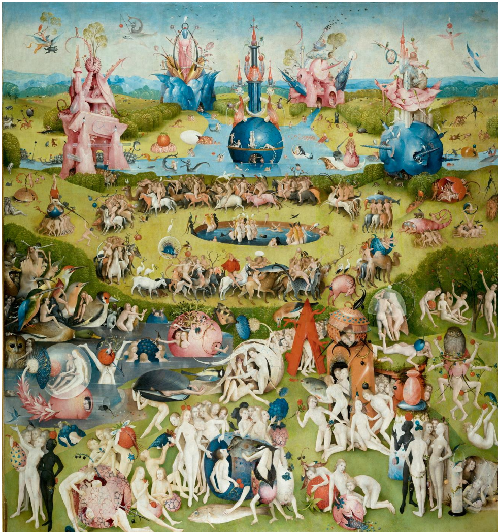
Jérôme Bosch, Le Jardin des Délices , (panneau central), 1503, Madrid, Musée du Prado.