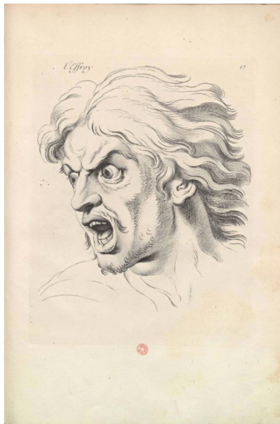
Charles Le Brun, L'Effroi , dans Expressions des passions de l'âme , Paris, 1727.