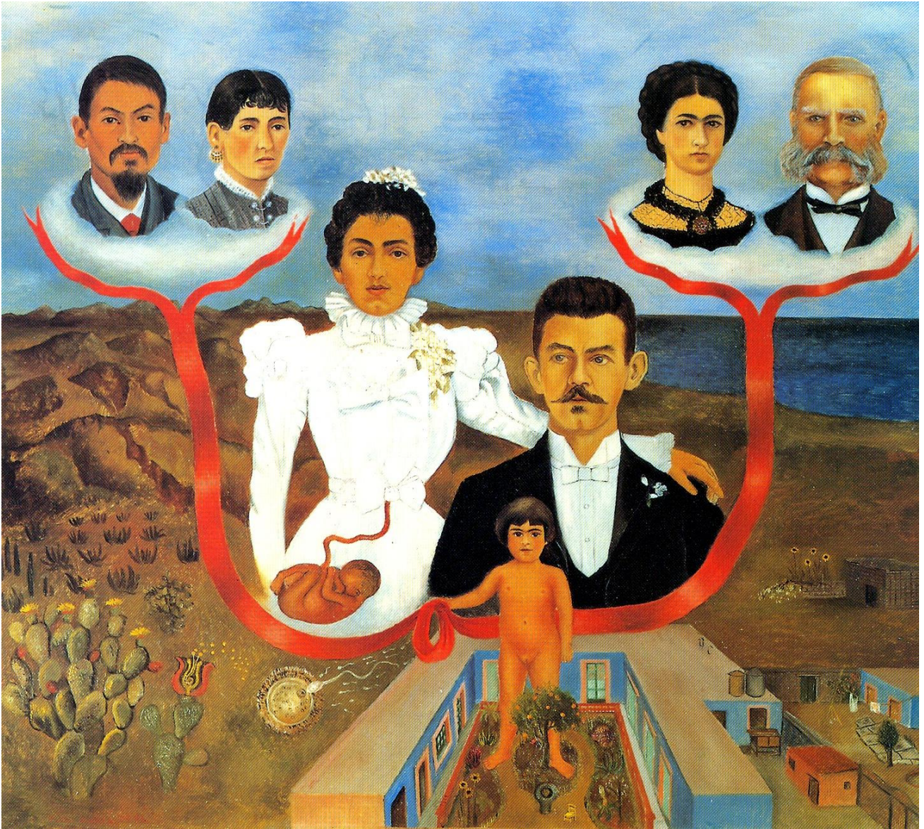
Frida Kahlo (1907-1954) : Mes grands-parents, mes parents et moi (arbre généalogique), 1936 Peinture à l'huile et à la tempera* sur métal (30,7 x 34,5 cm). Museum of Modern Art, New-York.