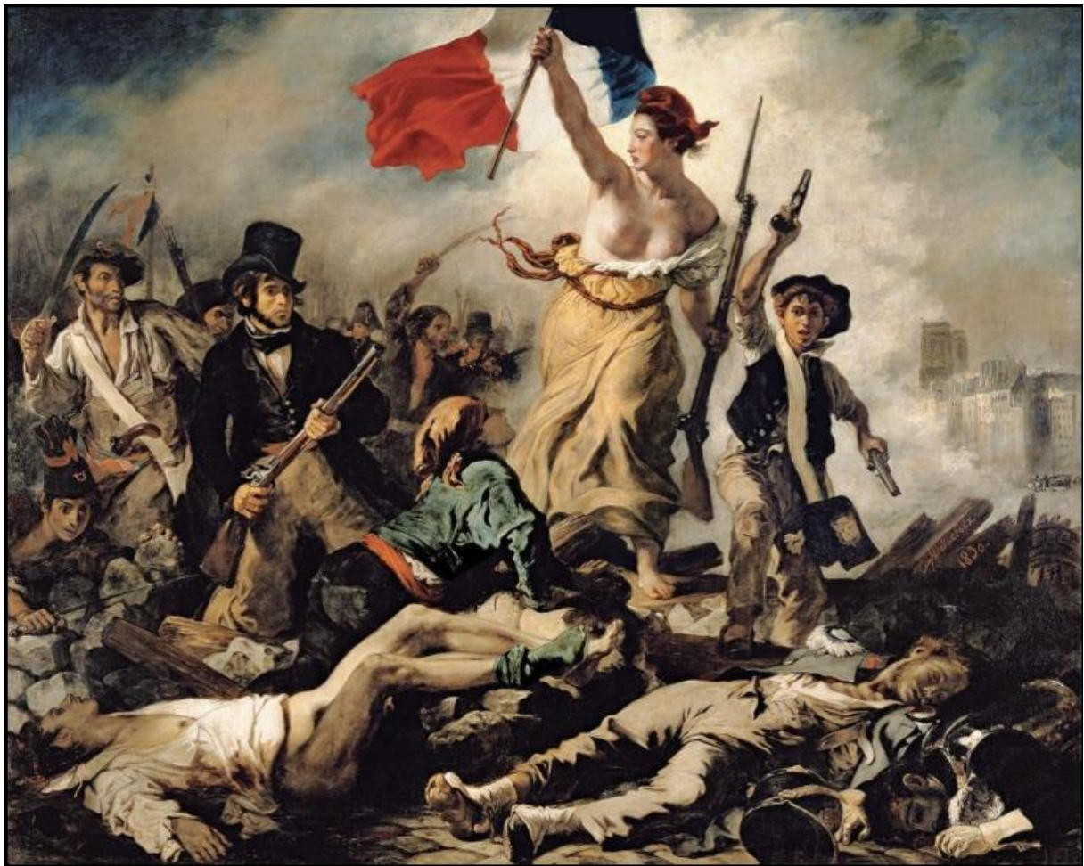
Eugène Delacroix, La Liberté guidant le peuple , 1830, huile sur toile, 260x325 cm, collection du Musée du Louvre.

La toile est en ligne sur le site de L'Histoire par l'image : https://histoire-image.org/fr/etudes/liberte-guidant-peuple-eugene-delacroix